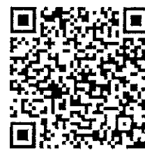
เปิดรับข้อเสนอโครงการฯ