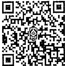
วิดีโอการบรรยาย