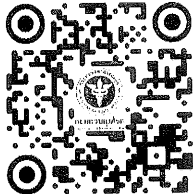
QR code ลงนามปฏิญาณตน