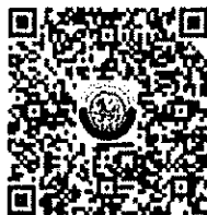
สรุปข้อมูลการขยายระยะดำเนินการ ณ วันที่ ๑๐ กันยายน ๒๕๖๓