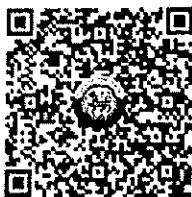
QR Code ตอบแบบสำรวจ