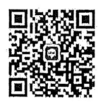
กลุ่มไลน์รุ่นที่ ๑