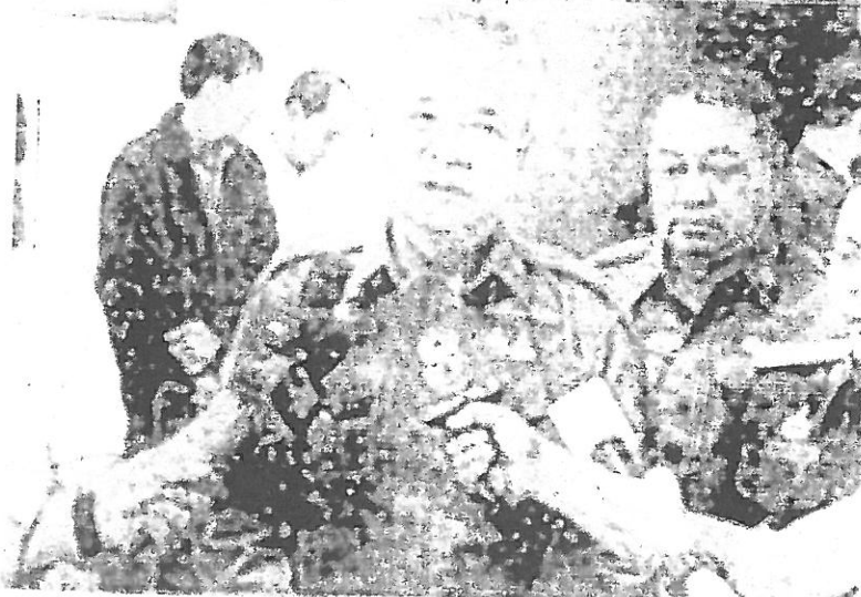
▲ ล้างโก่ง พล.ต.ต.กมล เจริญรักษา ผบก.ปปป. ให้สัมภาษณ์กรณีพบข้อมูลการทุจริตจัดซื้อรถดูดโคลน-รถขยะขององค์กรปกครองส่วนท้องถิ่น (อปท.) 33 แห่งทั่วประเทศ ส่งเรื่องให้ ป.ป.ช.เอาผิดไปแล้วบางส่วน.

ด้าน พล.ต.อ.ดำรงกล่าวไว้ ในคดีที่ 2 มี 12 อปท. มี 10 อปท. ประกอบด้วย เชียงใหม่ ชลบุรี นครราชสีมา โขงไกล ระยอง ศรีสะเกษ เพชรบูรณ์ สิบบุรี สุพรรณบุรี และนนทบุรี ทั้งหมดมีพฤติกรรมการทุจริตครบ ขบวนการดูดโคลนได้งบประมาณรัฐในลักษณะบริษัทตัวแทนจำหน่ายไปผ่านลูกข่ายมีเงินเก็บเข้าเขต รวมที่รับดูดโคลนไม่ได้รับมาตรฐานคุณสมบัติครบถ้วนอยู่ระหว่างดำเนินการสืบคดีของเทศบาลนครนนทบุรี บก.ปปป. รวมทั้งเตรียมประสานผู้ว่าราชการ