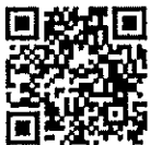
(นายธิตี ดอกแก้ว) ท้องถิ่นอำเภอฉบับแก่

กลุ่มงานการเงินบัญชี และการตรวจสอบ โทร. ๐๕๕ - ๔๐๓๐๐๘ ต่อ ๕