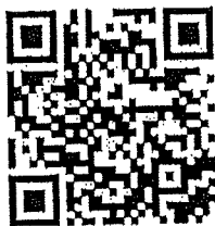
EHA Smart Web