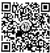
(สิ่งที่ส่งมาด้วย)