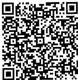
QR Code ๑ ยืนยันการเข้าร่วมอบรม