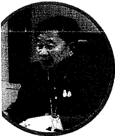
กুমพัทธ์ เรืองแห่ วชเลขาธิการสภาการศึกษา