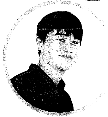
ครุर्मเกล้า ช่างนั โรงเรียนเทพศิลาประชาส จังหวัดนครสวรรค์